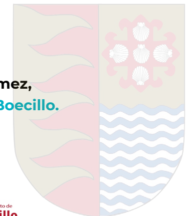
Raúl Gómez, Alcalde de Boecillo.