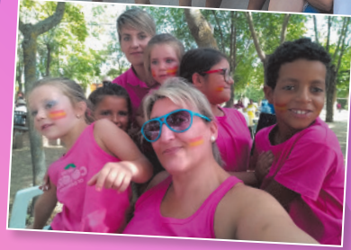
Peña La última y nos vamos