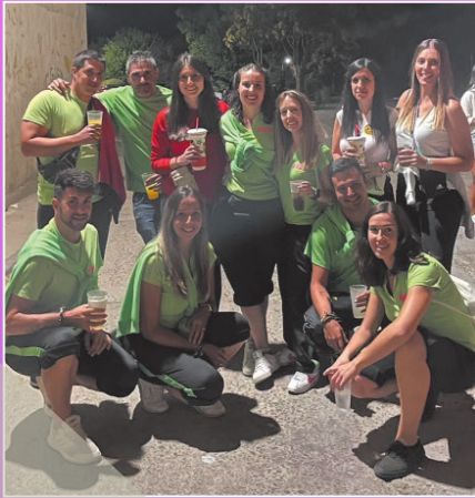
Peña NI + NI