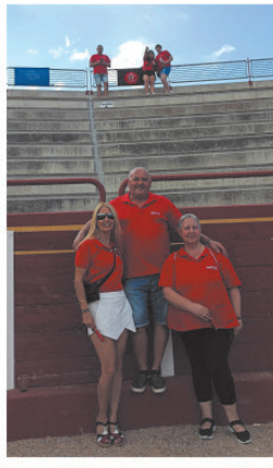
Peña La Barbacoa