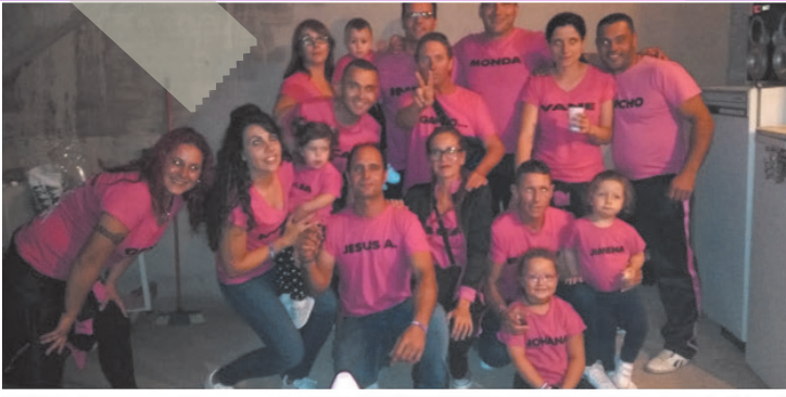
Peña El Tarterillo