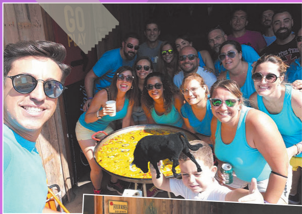
Peña El Garceo