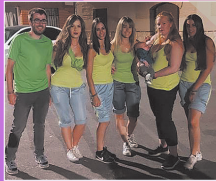
Peña Déja Vu