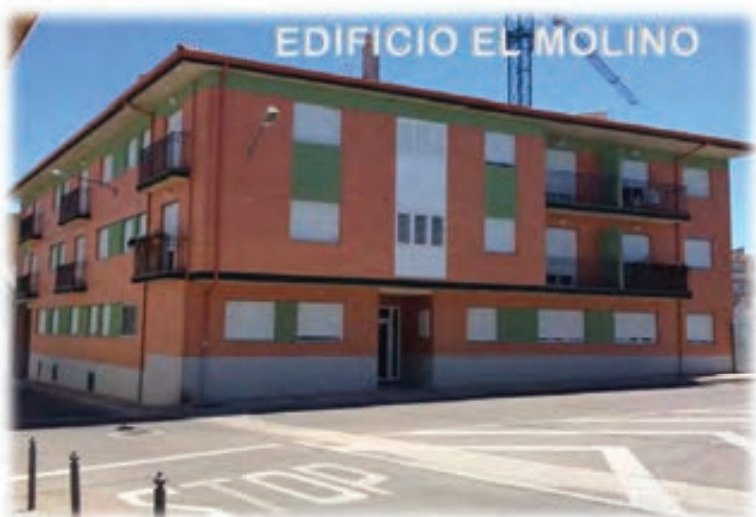
EDIFICIO EL MOLINO

Viviendas con garaje independiente para dos vehículos