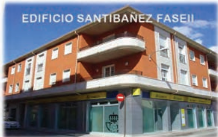
EDIFICIO SANTIBAÑEZ FASE II

Viviendas con garaje independiente para dos vehículos