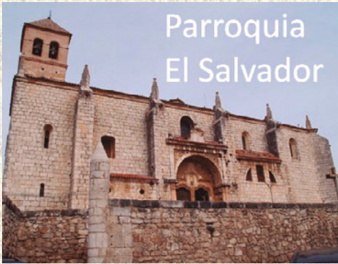
Parroquia El Salvador