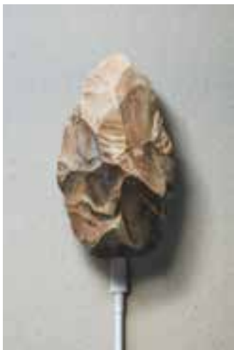
ilustración de portada: