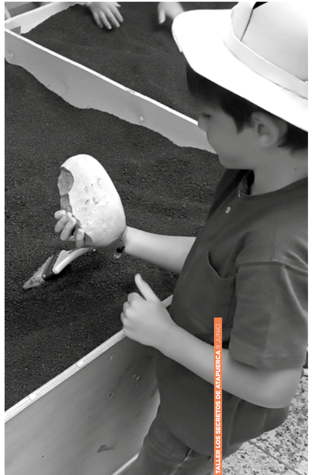
TALLER LOS SECRETOS DE ATAPUERCA 8 JUNIO